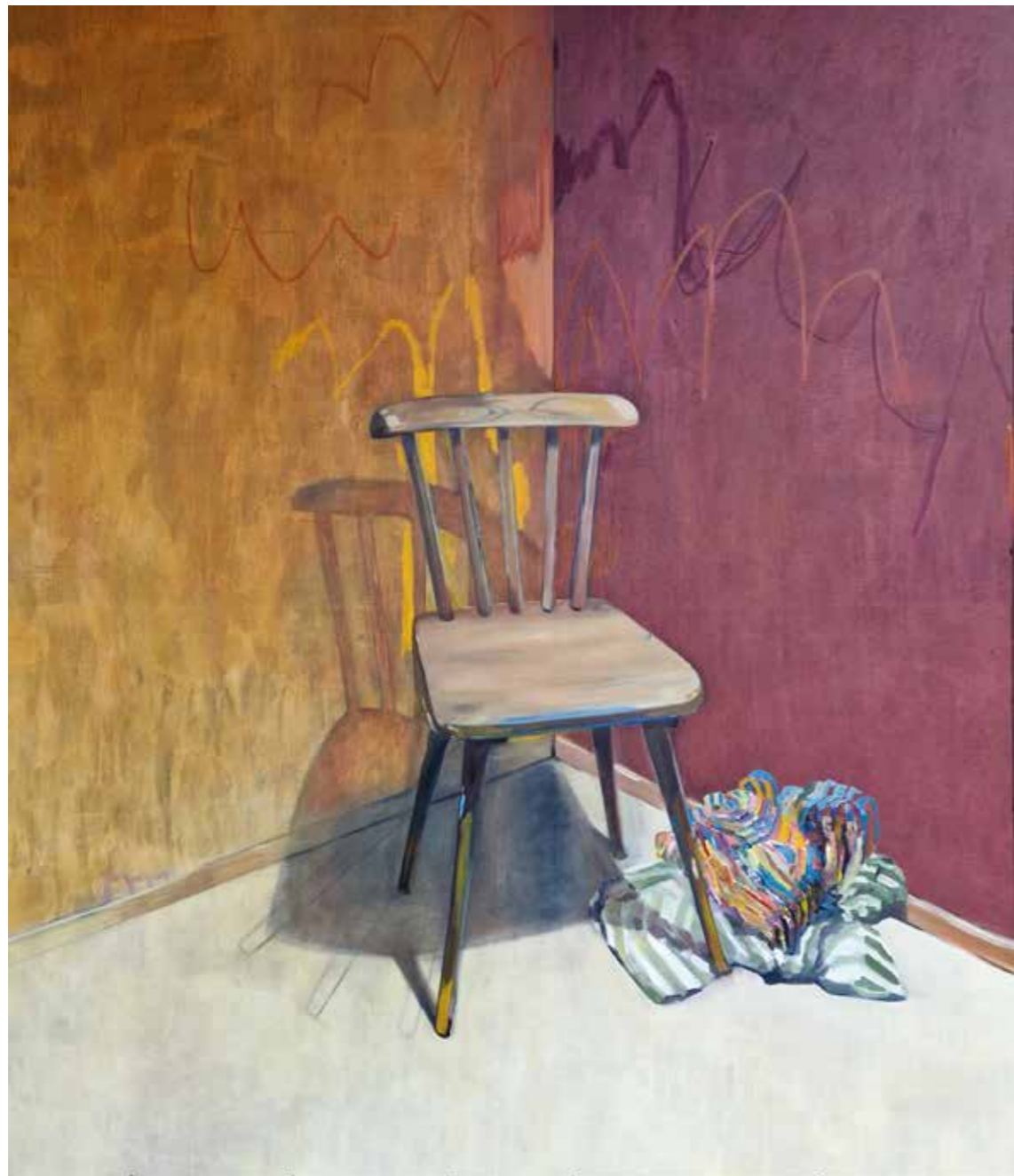
Chaise de studio , 2023, technique mixte, huile et pastel sur toile, 150 x 130 cm 7 000 €