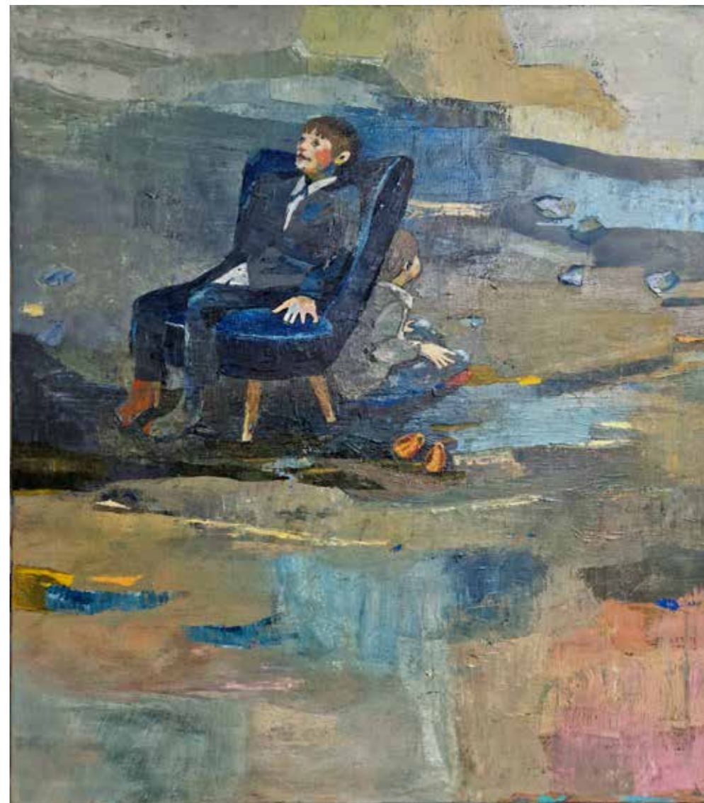
Le fauteuil et le pouvoir de la pensée, 2023, technique mixte, huile et pastel sur toile, 90 x 80 cm 3 600 €