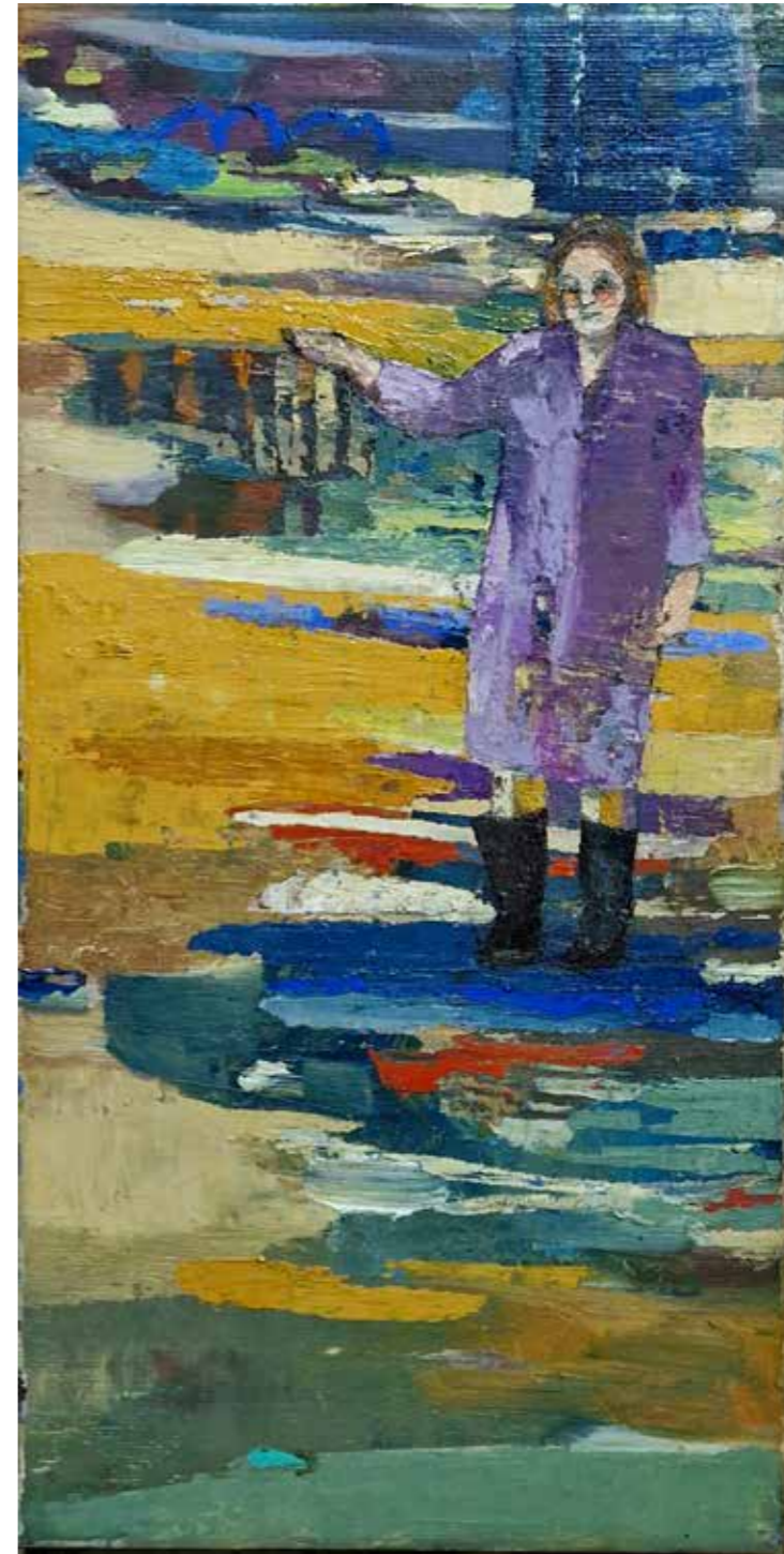
Viens oiseau (femme), 2023, huile sur toile, 40 x 20 cm Réservé