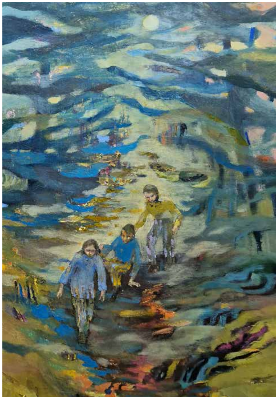
Le passage, 2023, huile sur toile, 96 x 75 cm Réservé