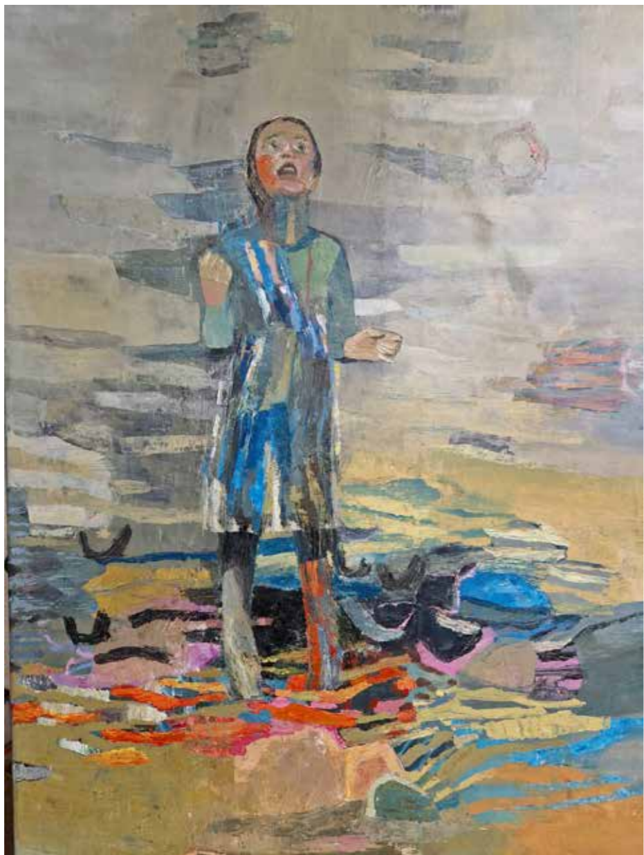
La Jongleuse, 2023, technique mixte, huile et pastel sur toile, 120 x 80 cm Réservé