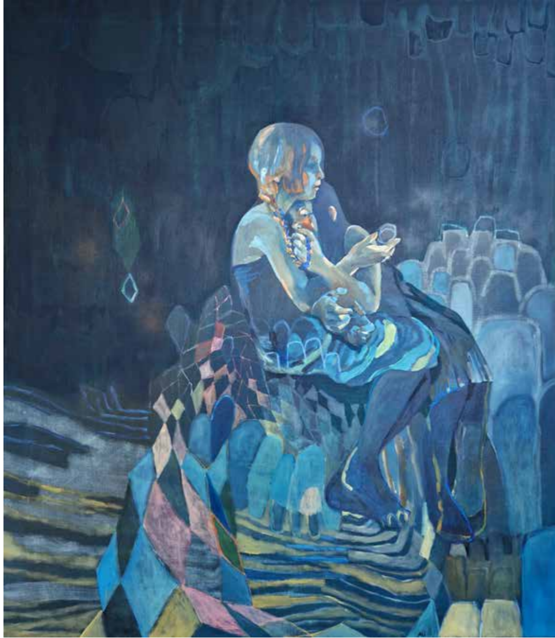
Pas seul , 2023, huile et pastel sur toile, 150 x 130 cm Réservé