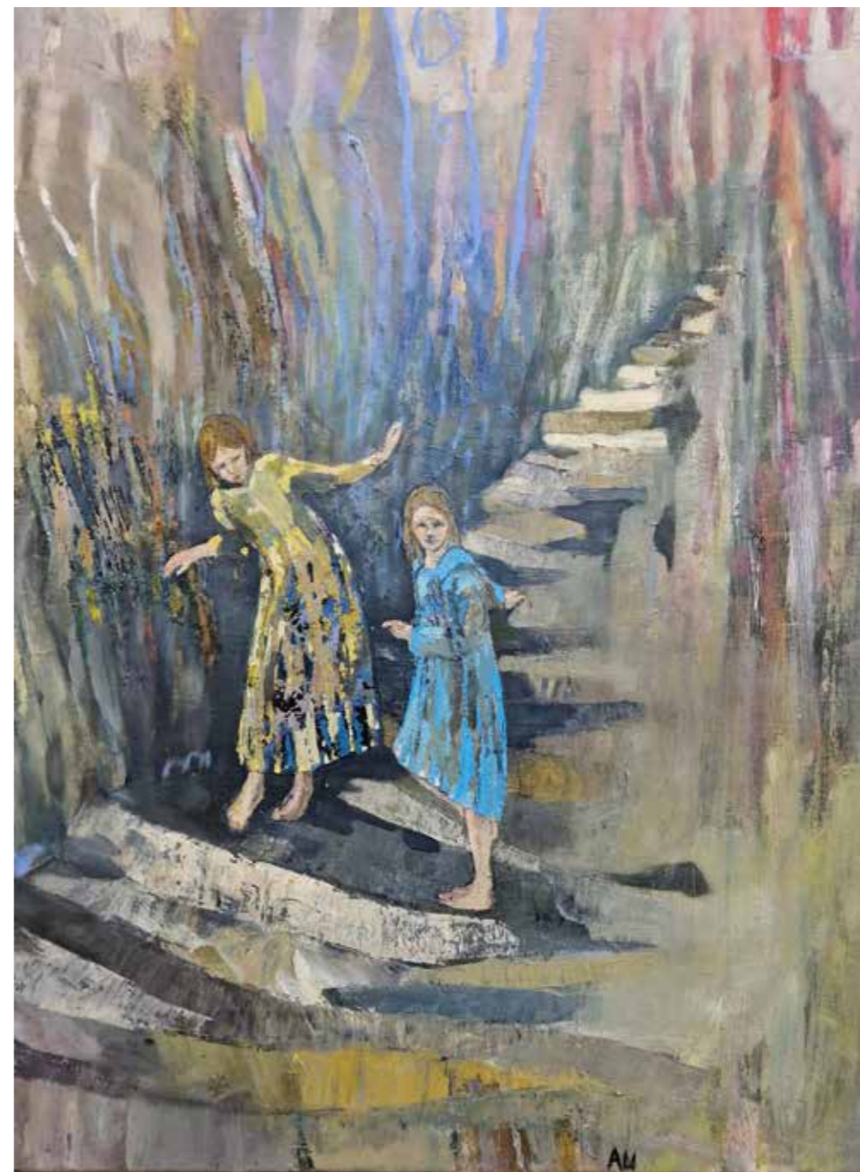
Elles avaient suivi un chat aux yeux verts, 2023, huile et pastel sur toile, 100 x 81 cm 3 800 €