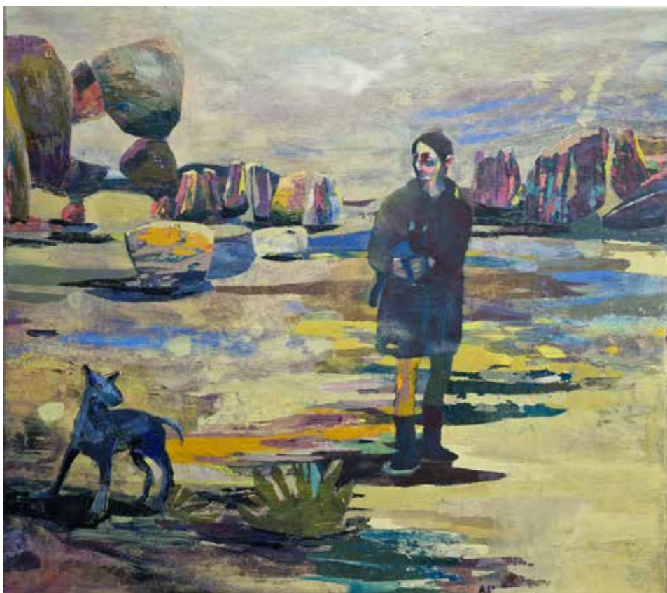
Faire confiance au chien, 2023, technique mixte et huile sur toile, 65 x 50 cm Réservé