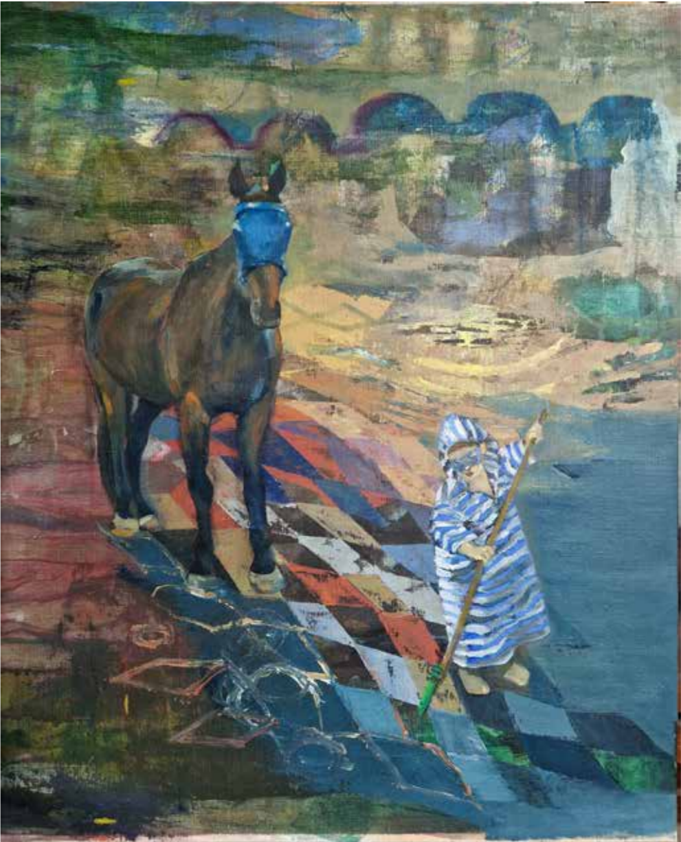
Dag och Natt/ Jour et Nuit, 2023, huile et pastel sur toile, 80 x 65 cm 3 100 €