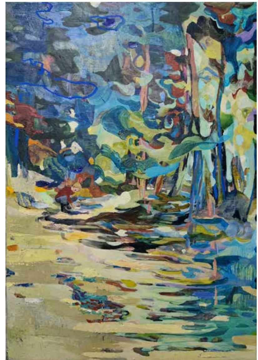
Un fragment de forêt, 2023, acrylique et huile sur toile, 70 x 50 cm Réservé