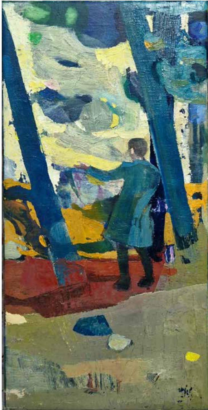
Viens oiseau (homme), 2023, huile sur toile, 40 x 20 cm Réservé