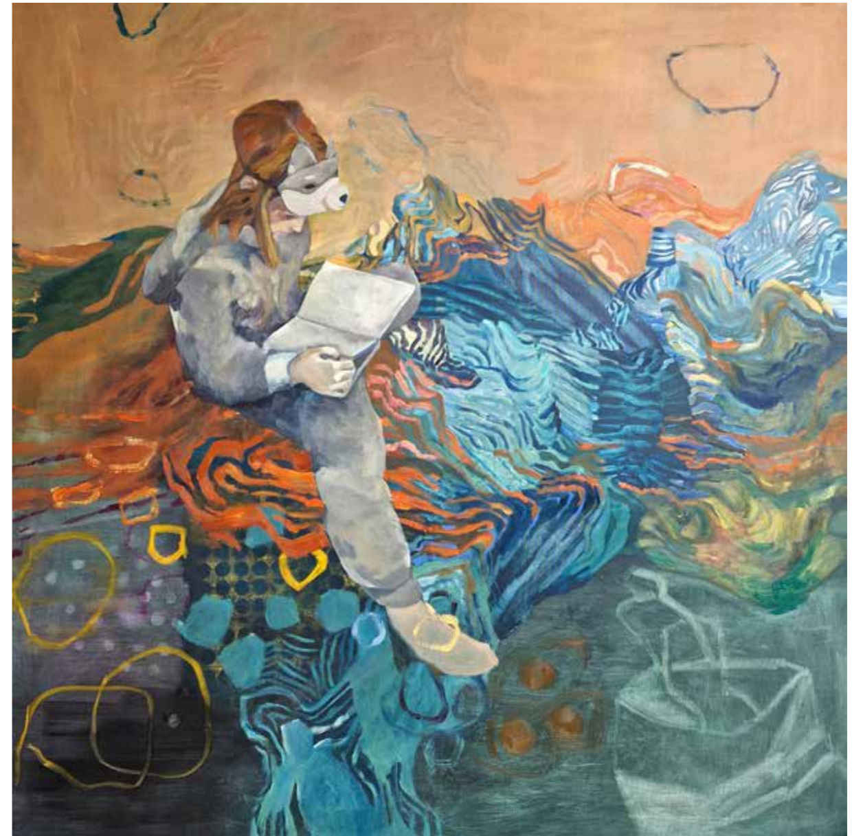
Une autre réalité, 2023, technique mixte, huile et pastel sur toile, 145 x 145 cm 7 500 €