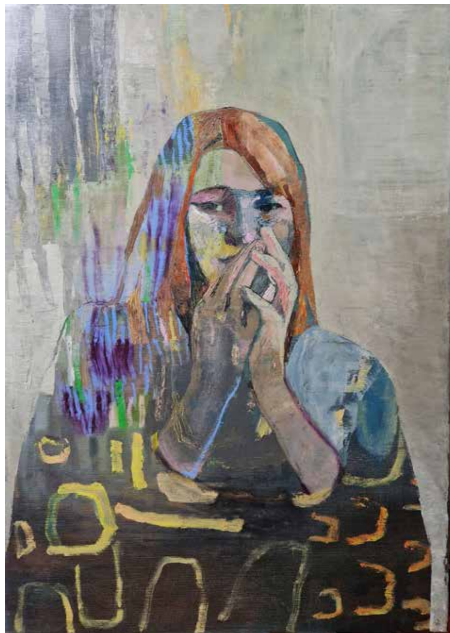
Veux-tu savoir , 2023, huile sur toile, 70 x 50 cm 2 600 €